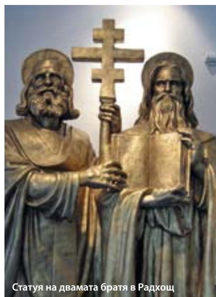
Статуя на двамата братя в Радхощ