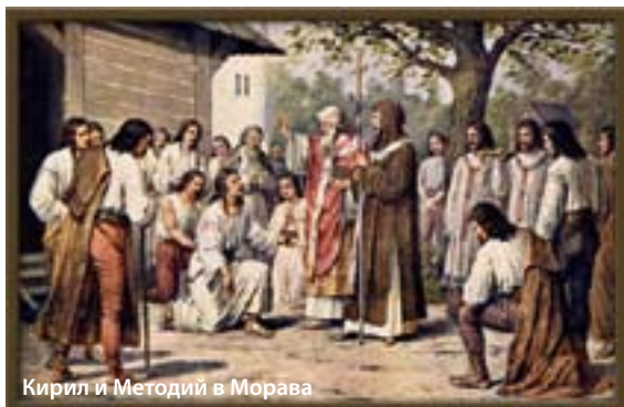
Кирил и Методий в Моравя

Солунските братя са създатели на славянската писменост и разпространители на християнската просвета сред славяните. Буквите, създадени от Кирил и Методий, преводите, които правят на най-важните богослужебни книги, защитата на правото на всеки народ да славя Бога на своя език, имат голяма историческа значимост за формиране на идентичността на славянските народи, а делото на равноапостолите е високохуманно и всеславянско.