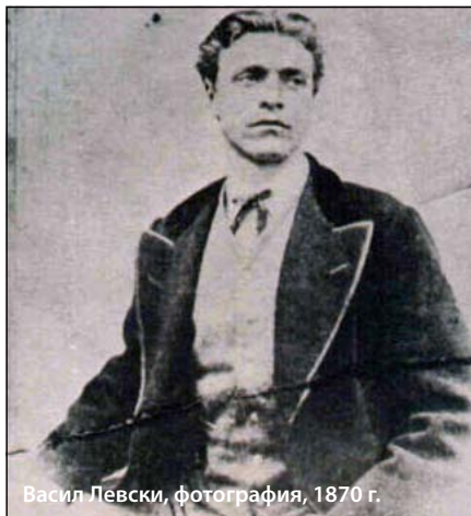
Васил Левски, фотография, 1870 г.

След март 1866 г. за Васил Левски става невъзможно да остане в родния си край, а и вероятно там вече е тясно за неговата душа. По това време у младия човек са се избистрили идеите за това, какво трябва да се направи, как трябва да се организира потиснатият български народ, за да заслужи и извоюва свободата