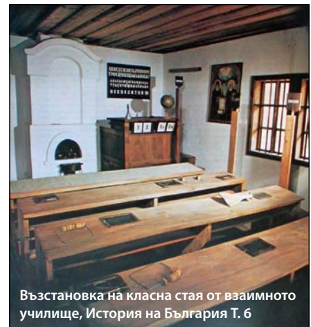
Възстановка на класна стая от взаимното училище, История на България Т. 6