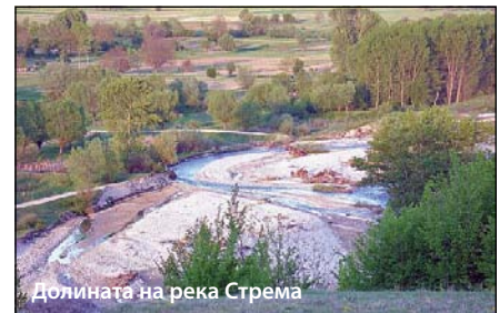
Долината на река Стрема

селяните се стекли масово най-тържествено да изпратят своя обичан даскал и приятел. От 23 април 1864 г. до началото на 1867 г. е периодът в живота на Васил Левски, който той прекарва като учител. Още тогава бъдещият революционер си спечелва любовта на децата, младите и възрастните българи, почувствали нуждата родината им час по-скоро да отхвърли чуждото владичество. Подготвя ги физически и морално за предстоящата трудна и продължителна борба за народно освобождение. Васил Левски е учител в прекия и преносния смисъл на тази дума, защото освен че работи като такъв, като революционер продължава да учи българите на самоуважение, сила и смелост. Методите, които използва, са разнообразни и модерни, но най-важни са личният пример и благородството. Васил Левски е учител на онези българи, които ще застанат начело на борбата за освобождение на потиснатия народ, чиято най-ярка и значима изява ще е Априлското въстание от 1876 г. и Българското опълчение, което ще изиграе ключова роля в хода на Руско-Турската война от 1877–1878 г.