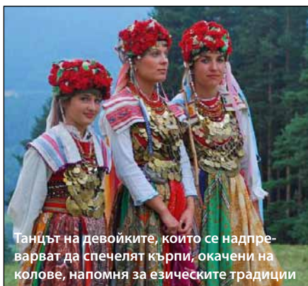
Танцът на девойките, които се надпреварват да спечелят кърпи, окачени на колове, напомня за езическите традиции