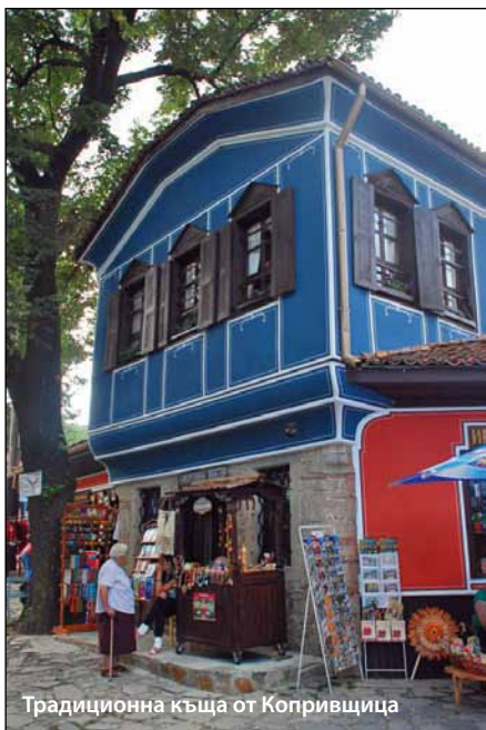
Традиционна къща от Копривщица