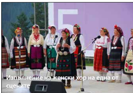
Изпълнение на женски хор на една от сцените