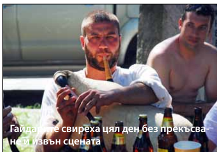
Гайдаците свиреха цял ден без прекъсване и извън сцената