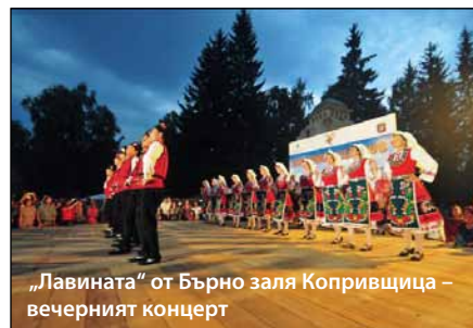
„Лавината“ от Бърно заля Копривщица – вечерният концерт