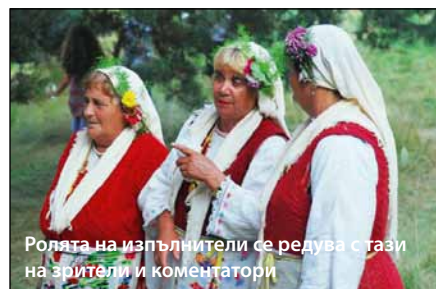
Ролата на изпълнители се редува с тази на зрители и коментатори