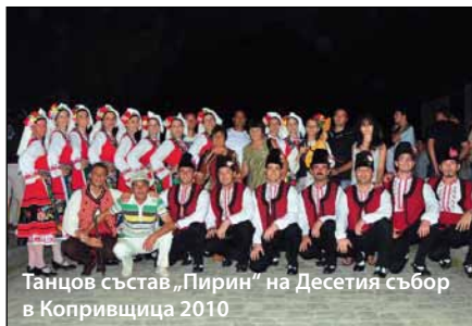
Танцов състав „Пирин“ на Десетия събор в Копривщица 2010