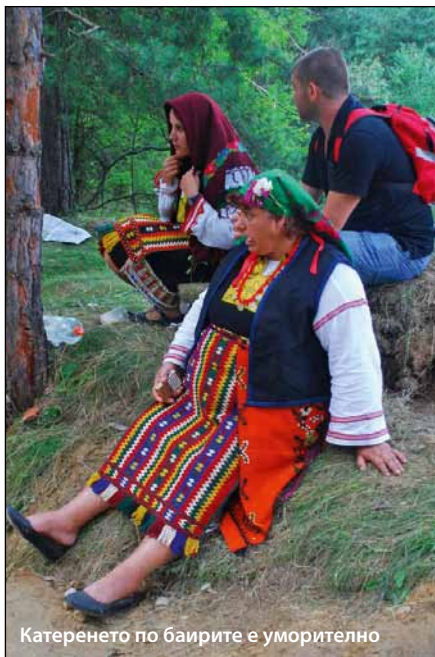
Катеренето по баирите е уморително