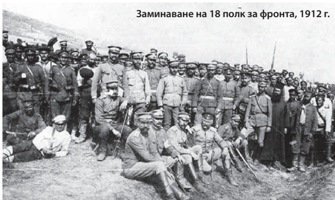
Заминаване на 18 полк за фронта, 1912 г.