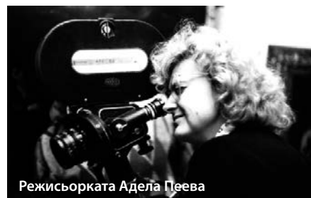
Режисьорката Адела Пеева