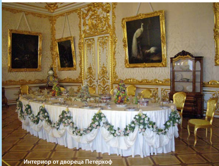
Интериор от двореца Петерхоф