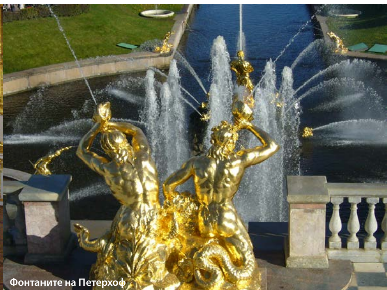
Фонтаните на Петерхоф

ден конник“. До Исаковския площад е друг символ на града – Исаковският събор. Там слязохме от автобуса, за да се насладим на красотата и величието на този най-ярък паметник на архитектурната хармония между Европа и Русия. Импозантност и внушителност по руски, но в архитектурните елементи доминира Европа – от древна Елада, през ренесансова Италия, до барокова Германия. Строен е четиридесет години и е главен храм на руската империя. Най-голям е в страната и четвърти в света след „Св. Петър“ в Рим, „Св. Павел“ в Лондон и „Санта Мария дел Фьоре“ във Флоренция. Жалко, че не ни се предостави възможност да надникнем и под куполите му, където от фотографии знаех, че изобилства с красота и величие. Нямахме възможност да видим интериора и на следващия храм, пред който спряхме за фотографии. На мястото, където се намира, е смъртно ранен нашият цар Освободител и е издигнат в негова памет. Осветен е като „Възкресение Господне“, но най-вече се знае като „Спас на Крови“, навярно заради пролятата кръв. Неговият впечатляващ вид си е чисто руски, с типичните пъстроцветни куполи и позлати и силно напомня московския „Василий Блаженный“.