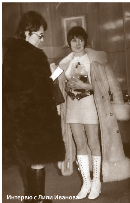
Интервю с Лили Иванова