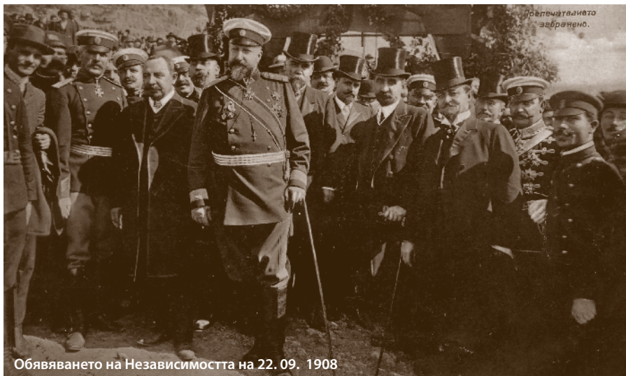
Обявяването на Независимостта на 22. 09. 1908

На 22 септември 1908 г., 30 години след Освобождението, княз Фердинанд обявява с Манифест към българския народ независимостта на България