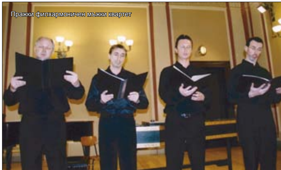
Пражки филхармоничен мъжки кuartет