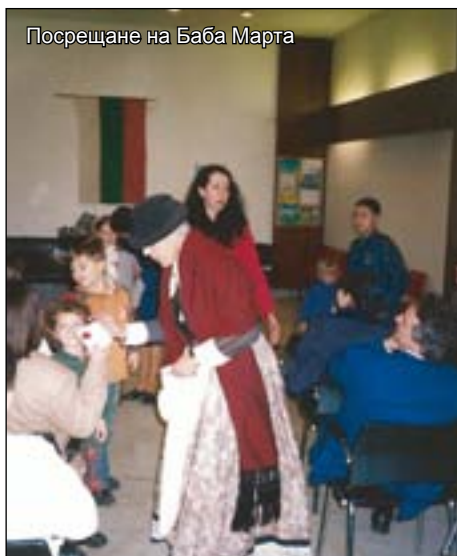
Посрещане на Баба Марта