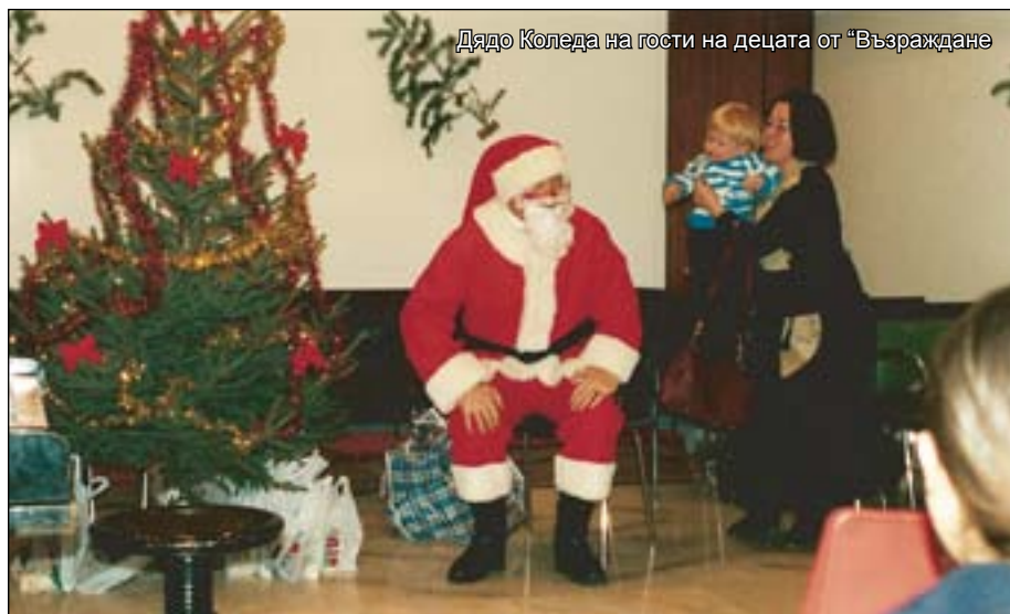
Дядо Коледа на гости на децата от "Възраждане"