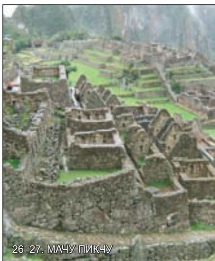
26–27. МАЧУ ПИКЧУ

170 ГОДИНИ ОТ РОЖДЕНИЕТО НА ВАСИЛ ЛЕВСКИ; НЯМА ГИ ВЕЧЕ ДЯДО ВАЗОВ И ДЯДО МЪРКВИЧКА ДА СЕ ХВАНАТ ПОД РЪКА