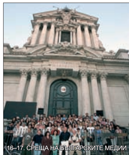
16–17. СРЕЩА НА БЪЛГАРСКИТЕ МЕДИИ