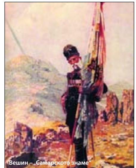
Вешин – „Самарското знаме“