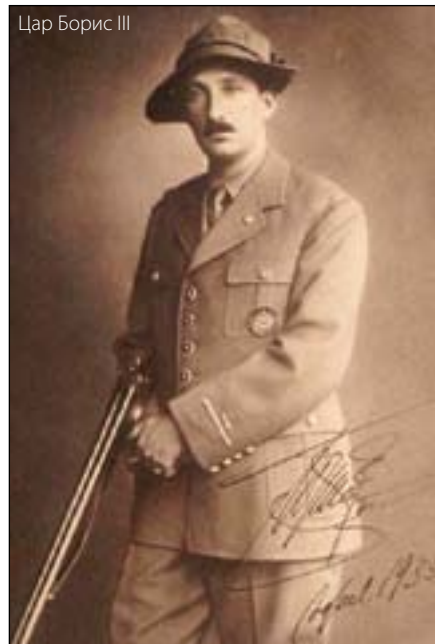
Цар Борис III

Точно преди 80 години, в началото на месец април, вестник „ Národní listy “ съобщава, че „ предната вечер в 21 часа и 25 минути, сряда, на една от пражките гари, „Ернст Дьони “, инкогнито пристигна българският цар Борис III“. Той е съпровождан от полк. Драганов и от директора на царския научен институт д-р Иван Буреш. Както повелява протоколът, на гарата българският монарх е посрещнат от посланика д-р Борис Вазов, брат на народния поет Иван Вазов, съпругата на посланика и останалите членове на дипломатическата мисия. Предвижда се царят, който пътува инкогнито под името граф Рилски, да остане два или три дни в столицата на Чехословакия.