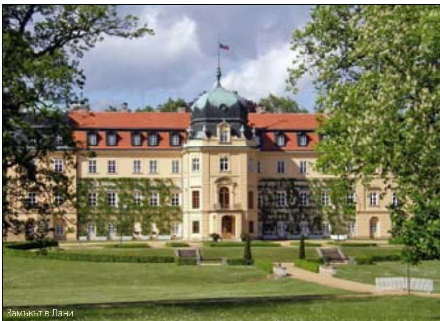
Замъкът в Лани

Изданието посвещава няколко статии на тази тема. Всъщност, доста показателна в това отношение е характеристиката, която вестникът му дава: „Младият български владетел принадлежи към малцината короновани особи, които са посвещавали свободното си време на науката. Днес той е единствен в това отношение“. Както се знае, неговият баща цар Фердинанд I е и неговият първи учител – самият той е запален ботаник и ентомолог, донасяйки със себе си редица нови видове насекоми по време на своите пътешествия. В обширна статия, озаглавена „Българският крал Борис III възхитен от колекциите в националния музей в Прага. Височайше посещение на славянски владетел при чешки учени“, изданието представя подробна картина от посещението му във въпросния музей. Описвайки младият владетел като любител и познавач на флората и фауната, вестникът дава интересна информация за срещата му с шефа на музея д-р Обенбергер – по време на обиколката си из