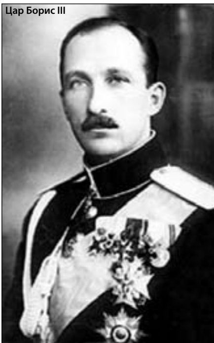
Цар Борис III

Българският монарх е първият владетел на славянска държава, който посещава Прага. Затова журналистите на „ Národní listy “ не крият симпатиите си към неговата личност, описвайки го като човек с „ модерни разбирания “, високообразован: „Цар Борис III грабва вниманието чрез любезното и непринудено държание още при първата среща. Облечен е съвсем скромно, в тъмносини дрехи, черно градско палто, твърда шапка, а в ръцете си държи бастун. Не обича почестите и бърза винаги първи да подаде ръка, а с усмивката и говора си иска да стопи дистанцията между него и събеседника си. Сивите му очи отразяват мечтателността на поетите и учените от висшите кръгове. Бурбонският му нос и свитата му уста „издават“ кралския му произход.“