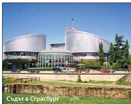
Съдът в Страсбург

В мотивите на съда се посочва, че има нарушение на член 9 на Европейската конвенция за правата на човека (свобода на религията)