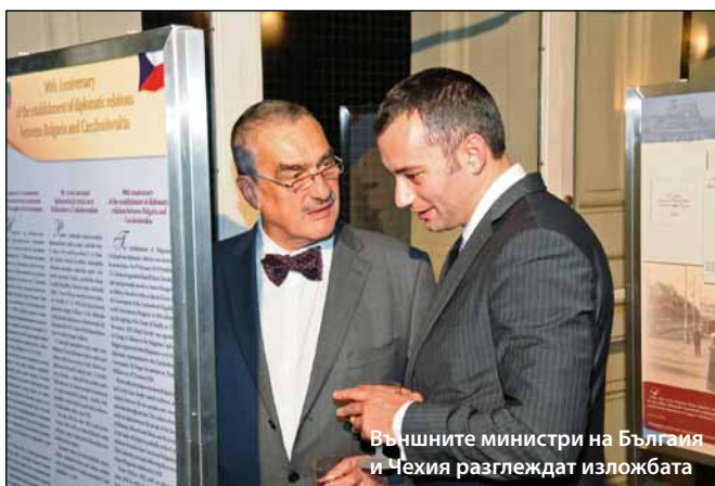
Външните министри на България и Чехия разглеждат изложбата

На 18 октомври във Факултета по обществени науки на Карловия университет българският външен министър изнесе публична лекция на тема: „Глобалната роля на ЕС – българската перспектива“. В лекцията си министър Младенов се спря на няколко важни въпроса. На първо място той подчерта, че ако Европейският съюз иска да бъде лидер в световен мащаб, той трябва да има по-глобална визия. От своя страна Република България разглежда ЕС като успешен модел за политическа интеграция в международен план.