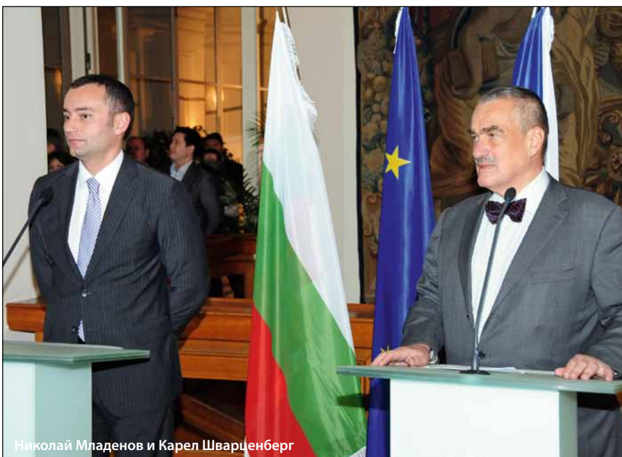
Николай Младенов и Карел Шварценберг

След изложбата „90 години от установяване на дипломатически отношения между България и Чехословакия“ в „Чернинския дворец“ Николай Младенов и Карел Шварценберг обсъдиха по време на работната вечеря възможностите пред държавите от ЕС за диверсификация на енергийните доставки. Двамата министри се договориха за по-голямо сътрудничество между България