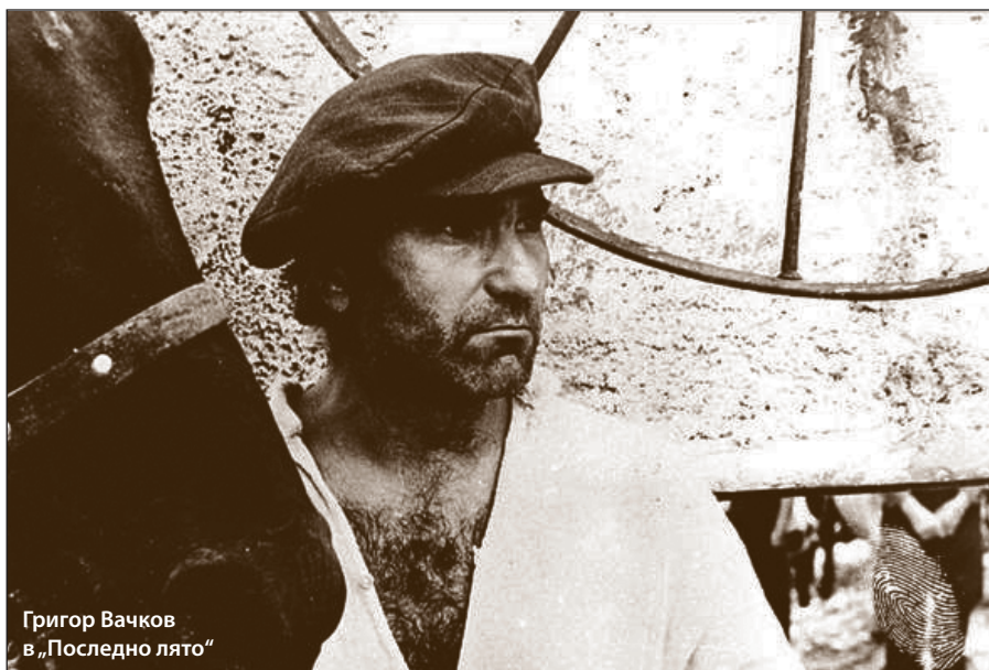
Григор Вачков в „Последно лято“

и нейните уникални герои, борещи се за свобода, човешко достойнство и личен възход.