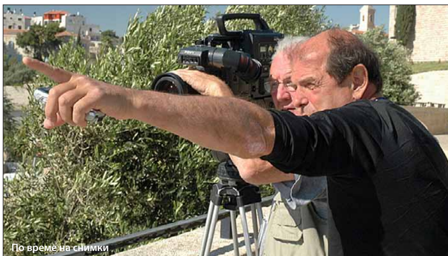
По време на снимки

След промените направихме „Наблюдател“ и първото, което предложихме, беше този филм. Отидохме в Цариград, вървахме по крепостните стени, плувахме с една лодка. Тончо Жечев възстановяваше през