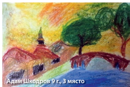
Адам Шкодров 9 г., 3 място