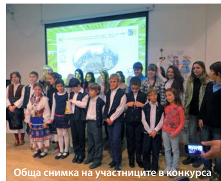
Обща снимка на участниците в конкурса

Традиционно е вече участието на учениците от БСОУ „Д-р П. Берон“ в национални и международни конкурси, доказвайки своите изключителни творчески заложби.