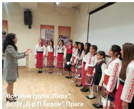
Вокална група „Лира“, БСОУ „Д-р П. Берон“, Прага