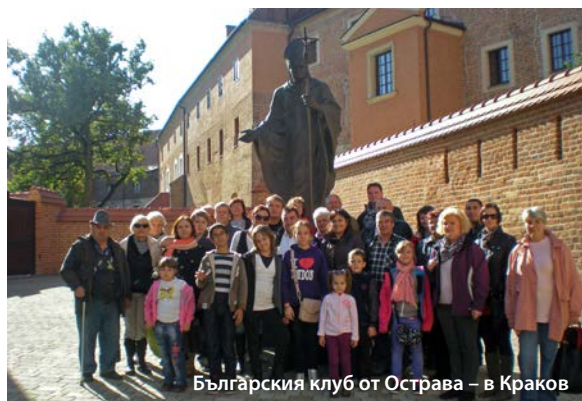
Българския клуб от Острава – в Краков